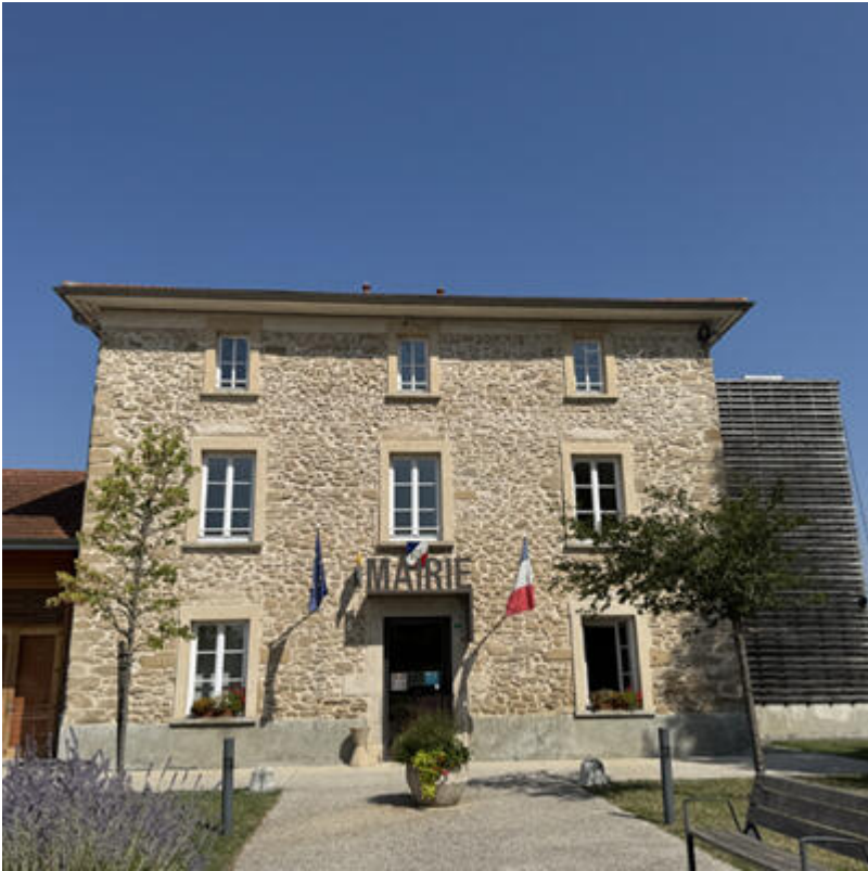
Mairie - Varacieux